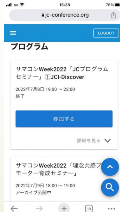
プログラム選択ページ