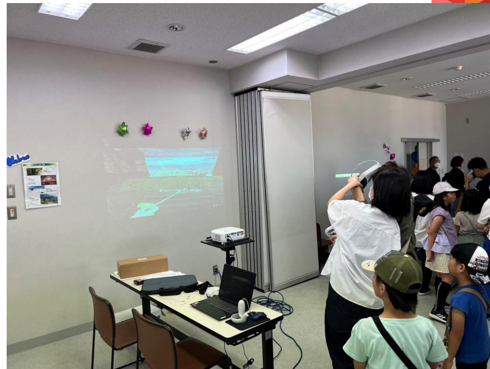
※ワールドテラスITブース写真