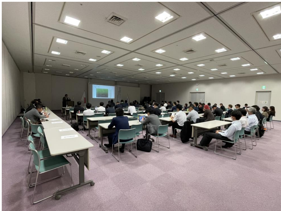
※7月例会後のDXセミナー写真