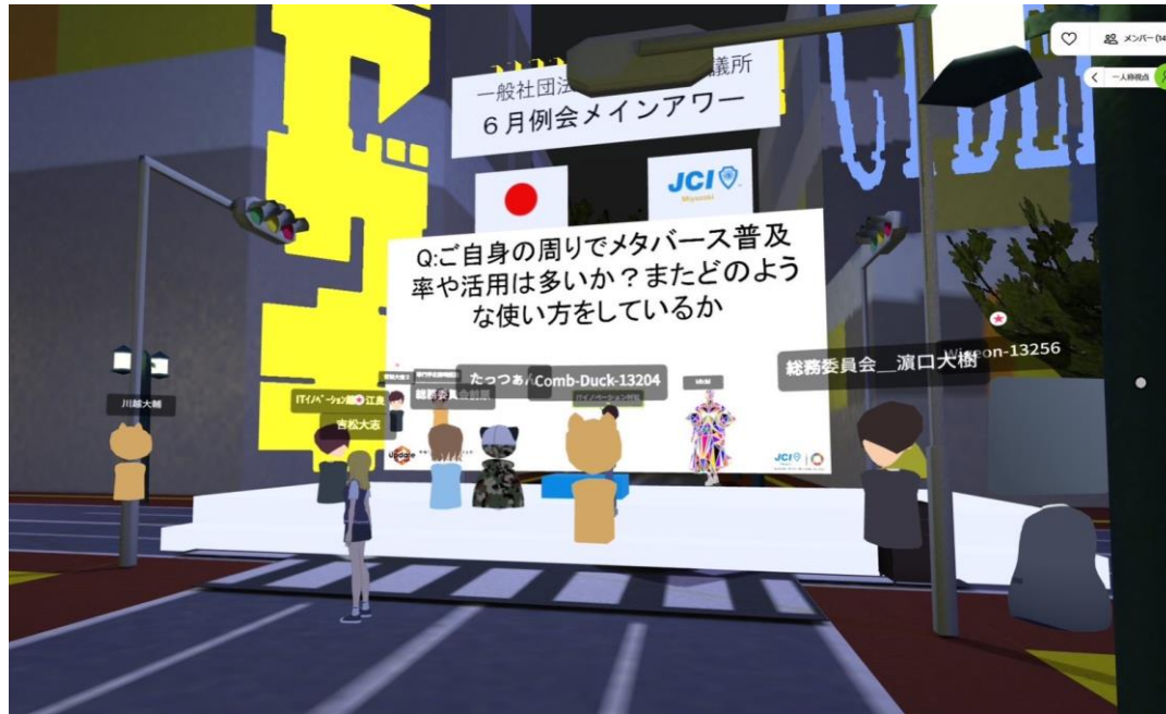
※6月例会メインアワー写真