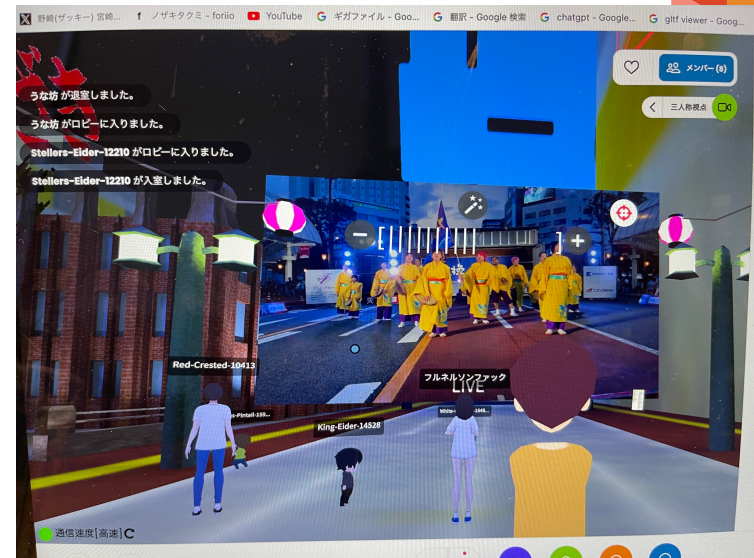
※宮崎Erekocha Festival 2023