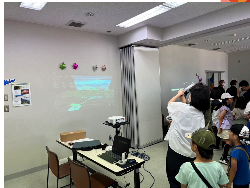
※World Terrace IT部分的照片