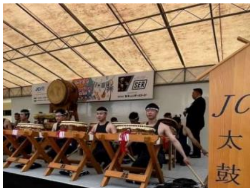
ベトナム人との和太鼓共演