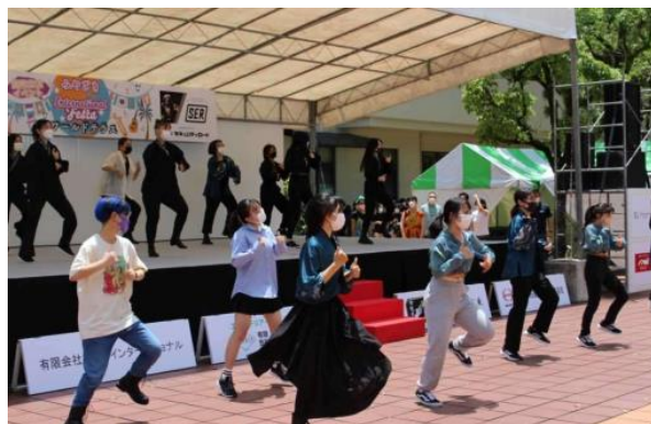
世界各国のダンスステージ