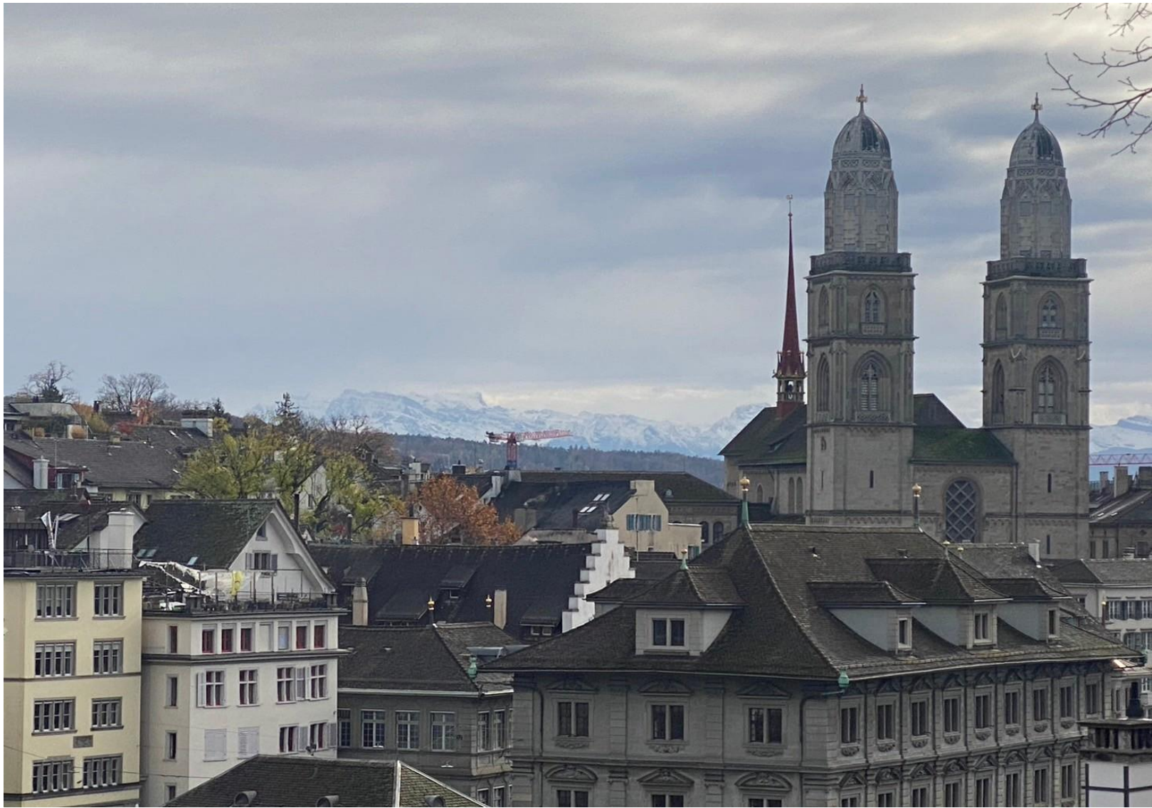
チューリッヒの街並み